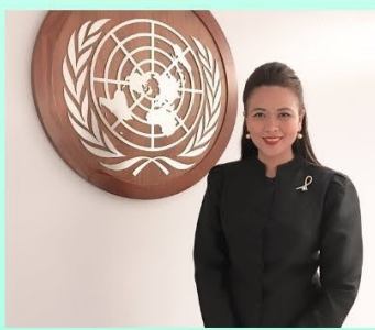
พบกับวิทยากร พศ.ดร.วิษญานี โอษา ที่ปรึกษาโครงการด้าน Gender Equality องค์การสหประชาชาติ